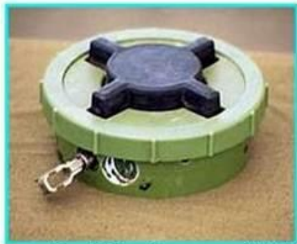
Рис.1 Общий вид мины ПМН-2

ПМН-2 Противопехотная мина нажимного типа