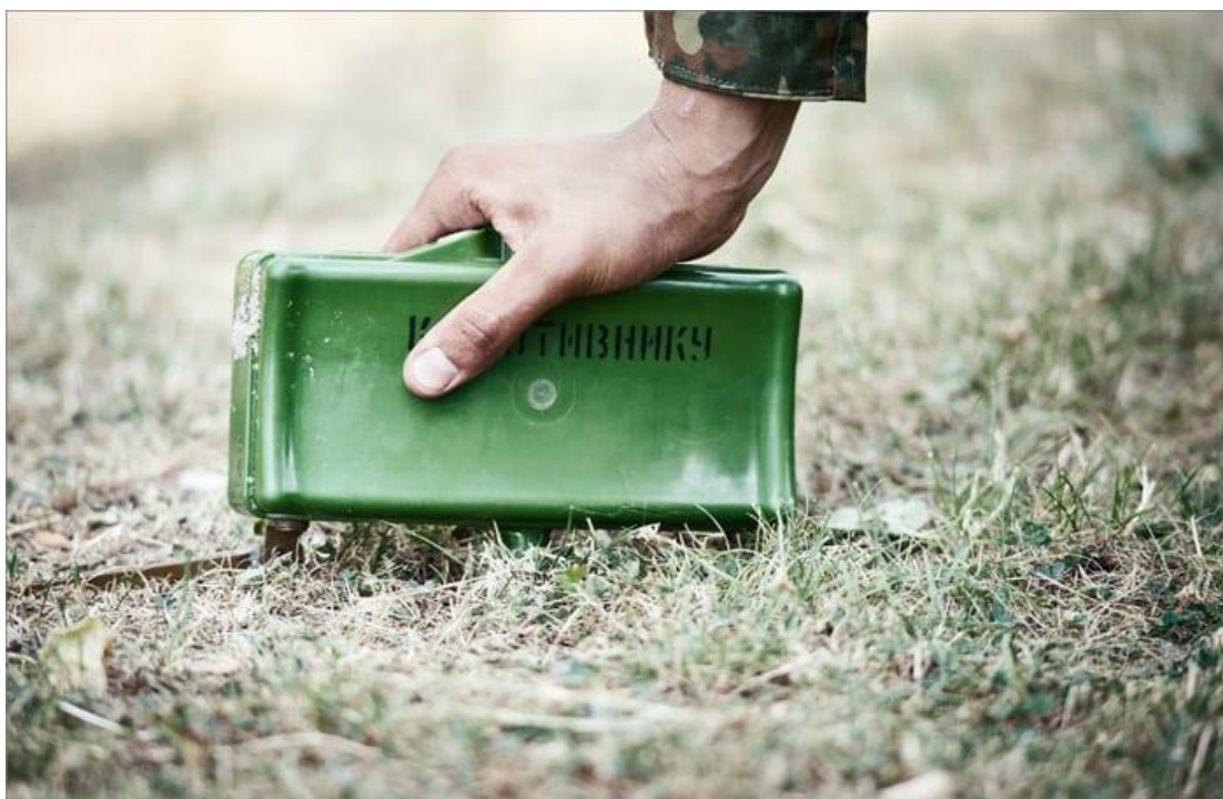
Мина в боевом положении